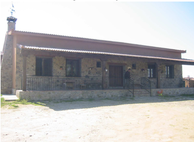
El Nido del Cuco. Valdeobispo.