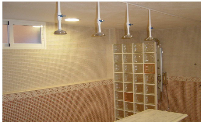
Turylud. Pozuelo de Zarcón.