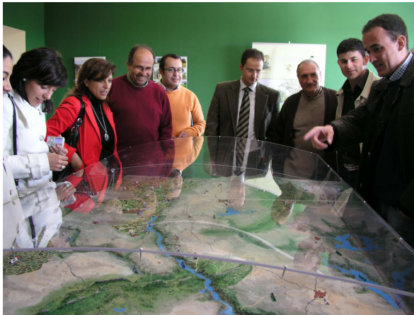
Inauguración C.I. “Canchos de Ramiro”.

Otro de los aspectos a tener en cuenta ha sido la creación de dos centros de interpretación –en la actualidad en fase de construcción- destinados a dos elementos fundamentales para entender la historia de la comarca del Valle del Alagón y que se erigen como dos grandes reclamos turísticos: el “Centro de Interpretación de los Canchos de Ramiro” en Cachorrilla y el “Centro de Interpretación de la Colonización y el Regadío” de Alagón.