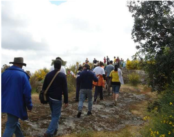
Ruta por las callejas de Valdeobispo.