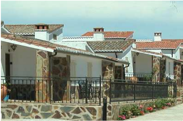
La Salgada. Torrejoncillo.