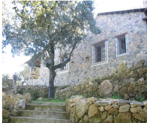
La Atalayuela. Valdeobispo.