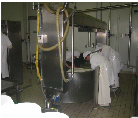
Fabrica de quesos Queval. Alagón.