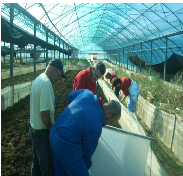
Alumnos del curso haciendo prácticas.

En este año hemos realizado con fondos de formación agraria de la Junta de Extremadura un curso de Helicicultura en Coria que finalizaron 14 alumnos y que supuso la tercera iniciativa de esta índole que organizamos en la comarca. El curso pretendía presentar al sector agrícola una alternativa a la producción agrícola tradicional, mostrar las diversas modalidades de producción del caracol, observar los distintos procesos de producción y comercialización de caracoles, mostrar el grado de adaptación de la variedad helix aspersa en Extremadura, favorecer el encuentro entre productores extremeños para abordar problemas comunes (plagas, alimentación,...).