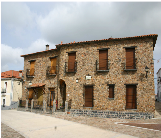
Los Canchales y El Boquerón. Cachorrilla.

En turismo hemos financiado la creación de los siguientes alojamientos rurales: “Los canchales” y “El boquerón” en Cachorrilla, “El nido del cuco” y “La atalaya” en Valdeobispo, “La salgada” en Torrejuncillo, “Turylud” en Pozuelo de Zarcón, “La posada de Pizarro” en Portezuelo, así como las empresas de ocio y tiempo libre: “Zircus” de Coria y “Rutas a caballo Santa Marina” de Portezuelo. De esta forma la oferta turística del Valle del Alagón alcanza la cifra de 18 casas rurales en toda la comarca, a las que hay que añadir los 12 establecimientos declarados como hoteles y hostales.