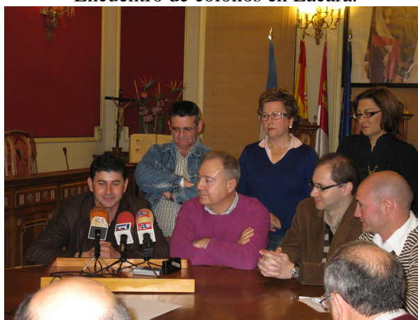
Rueda de prensa en Hellín (Albacete).