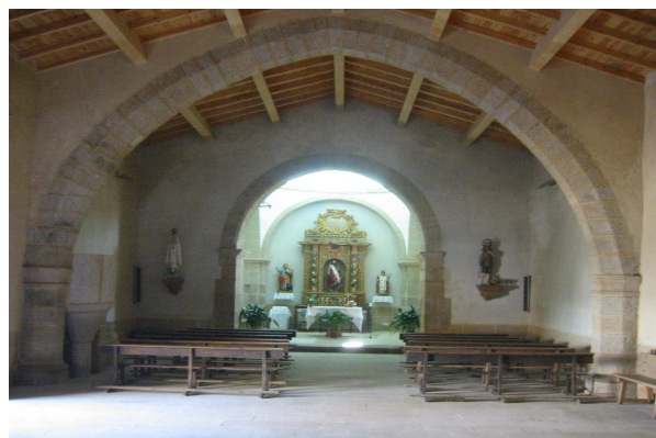
Rehabilitación de la Ermita San Bartolomé de Montehermoso.