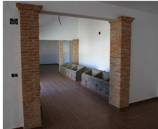
Obras del C.I. “Colonización y regadío”.

Una de las novedades en la ejecución de LEADER+ ha sido el trabajo realizado con niños. Con el objetivo de llegar hasta ellos hemos puesto en marcha 5 iniciativas: el “Programa Agroambiental” en el que participaron 491 niños de 9 colegios que visitaron nuestro huerto ecológico de Galisteo, el “Programa Encanchate” que consistía en la realización de visitas guiadas con guías ornitológicos a los “Canchos de Ramiro” y en el que participaron 442 niños de 10 colegios, las “Jornadas de formación agroambiental destinadas a escolares de la comarca” en las que nuestra intención fue ir a los colegios