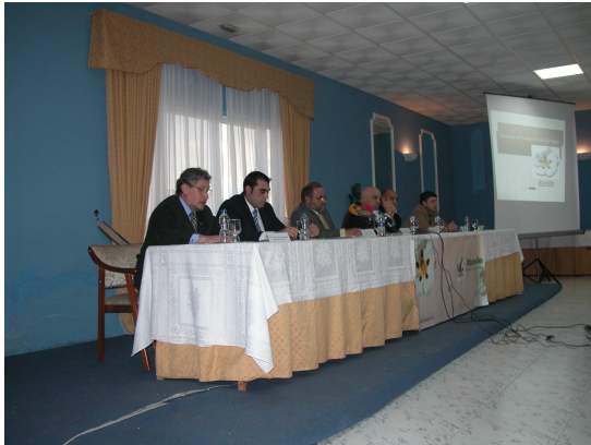
Presentación nueva J.D. "ATUVALLE".