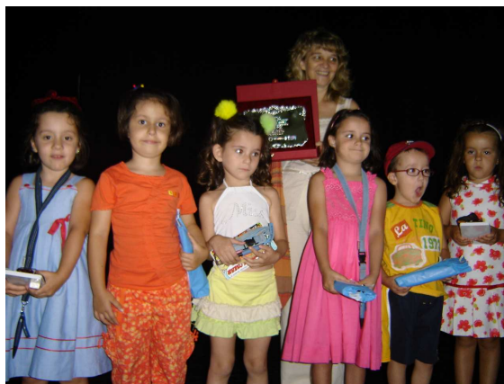
Ganadores de concursos infantiles.

En total hemos trabajado con casi 7,5 millones de euros de los cuales 3,3 millones han correspondido a distintas ayudas de la Unión Europea, Administración Central, Autonómica y Local y 4,2 millones de euros han correspondido al sector privado. Asimismo, se ha procedido a la firma de distintos convenios para el desarrollo de acciones como ha sido el caso de la formación a través de la Diputación de Cáceres. También con Diputación hemos firmado otros dos convenios destinados a apoyar la aportación económica de los ayuntamientos de la comarca y otro para tratar de garantizar la supervivencia de los equipos técnicos extremeños en la última parte del tramo comunitario. Con carácter local hemos firmado un convenio con el Ayuntamiento de Cachorrilla para la cesión de las instalaciones del antiguo colegio público y también otro convenio con la Mancomunidad Rivera de Fresnedosa destinado a la promoción y conservación del medio ambiente de la comarca.