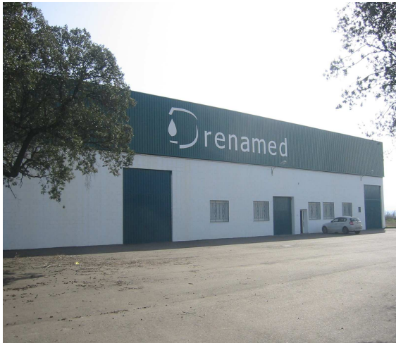
Drenamed. El Batán.