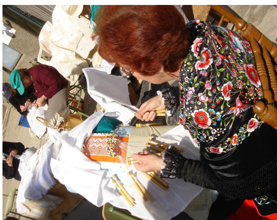
Festivalino de Pescueza.

En este período hemos contribuido de manera determinante a la creación de la identidad comarcal a través de la puesta en marcha y consolidación de eventos de gran trascendencia en el territorio como “La Primavera en la Dehesa”, en la cual han participado muchas de las localidades del Valle del Alagón a lo largo de las seis ediciones realizadas hasta la fecha, en ellas la implicación de los vecinos de la comarca ha sido masiva, fomentando de esta forma nuestra identidad a través de la valorización y promoción de las tradiciones del territorio.