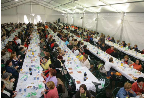
Convivencia regional de amas de casa.