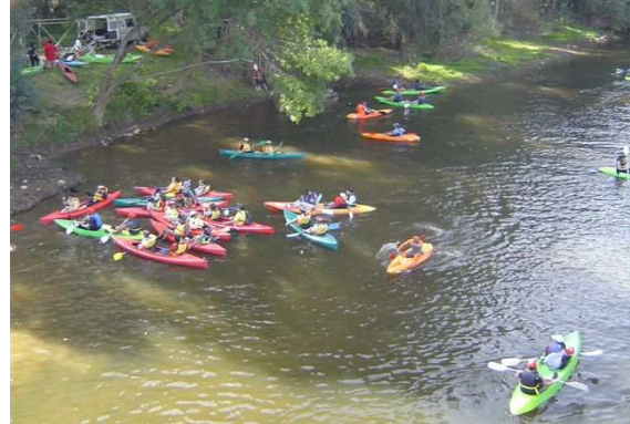
Descenso por el río Alagón.

Otro de los aspectos a tener en cuenta ha sido la creación de dos centros de interpretación –en la actualidad en fase de construcción- destinados a dos elementos fundamentales para entender la historia de la comarca del Valle del Alagón y que se erigen como dos grandes reclamos turísticos: el “Centro de Interpretación de los Canchos de Ramiro” en Cachorrilla y el “Centro de Interpretación de la Colonización y el Regadío” de Alagón.