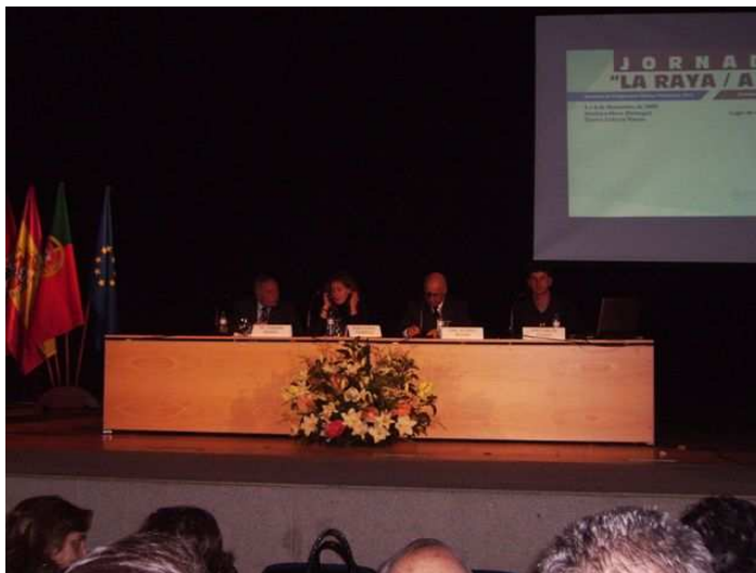
Acto de inauguración de la jornada.