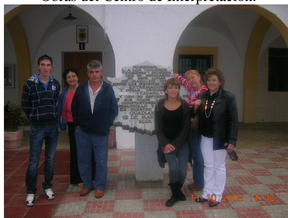
Encuentro de colonos en Lácara.