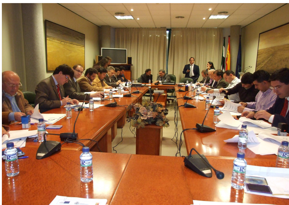
Firma convenio por parte de los 24 grupos extremeños de desarrollo.

A lo largo de este último año, las acciones desarrolladas han sido de diversa índole, destacando la concesión de dos programas pertenecientes a la Iniciativa Comunitaria Interreg III B en espacios distintos. Por un lado, en el espacio SUDOE (sudoeste europeo), somos socios de un proyecto denominado ADAPTA CLIMA en el que participan 9 entidades españolas, 4 portuguesas y 2 francesas y cuyo objetivo es realizar un gran estudio sobre el cambio climático en distintos escenarios climatológicos. En el espacio POCTEP (centro de Portugal-Extremadura-Alentejo), nos ha sido concedido el proyecto