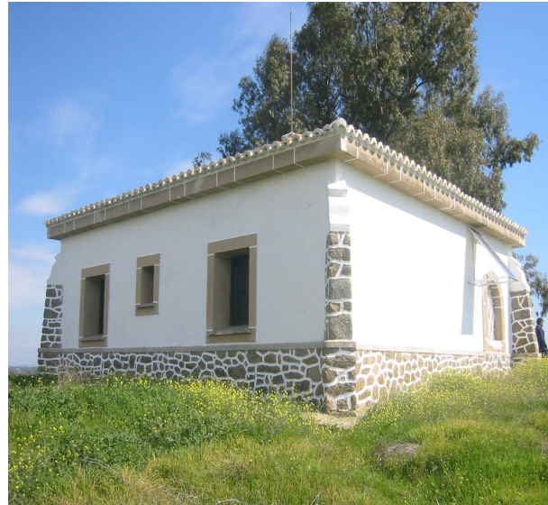
Centro de Interpretación de la dehesa. Aceituna.

Con la intención de revalorar espacios municipales infrautilizados hemos financiado 7 estudios en varias de las dehesas de la comarca para de esta forma tratar de garantizar su uso y gestión futura. En uno de esos casos el resultado ha sido la puesta en marcha del Centro de Interpretación de la Dehesa en Aceituna. En la línea de la recuperación del patrimonio hemos intervenido en la recuperación de iglesias y ermitas como las de Pozuelo de Zarzón, Montehermoso, Torrejoncillo o Coria, en la catalogación del archivo musical de la Catedral de Coria, en la digitalización del archivo histórico de Coria o en la creación del parque temático de Extremadura en Montehermoso.