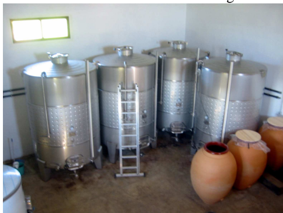
Bodega de vinos de la tierra. Ceclavín.