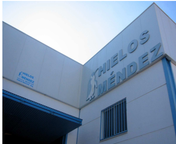
Hielos Méndez. Montehermoso

El LEADER ha cumplido ya una década en la comarca del Valle del Alagón, fraccionada en dos tramos: LEADER II y LEADER +. Han sido años en los que la iniciativa ha cargado su mochila de experiencias que permiten corregir las disfunciones del pasado y plantear nuevas estrategias para afrontar los retos del futuro. Durante este tiempo, los pueblos de nuestra comarca han experimentado cambios, concretados en una notable mejora de las condiciones de vida de la población. Una situación que no puede atribuirse en exclusiva al impacto de la iniciativa LEADER, ya que han existido otras actuaciones de las administraciones públicas (locales, regionales, nacional y europea) que sin duda, han contribuido a elevar la calidad de vida de la población de la comarca. No obstante para nosotros, lo más importante en todo este proceso ha sido precisamente la manera en que entre todos lo hemos construido. Es decir, la iniciativa LEADER nos ha dado la posibilidad de difundir la idea de que el desarrollo del Valle del Alagón depende, en última instancia, de la actitud que adopte nuestra población y del grado de implicación de nuestras gentes, señalando insistentemente que es la voluntad participativa lo que le permite aprovechar las múltiples oportunidades que hoy ofrece el vertiginoso proceso de cambio al que están abocadas las sociedades contemporáneas.