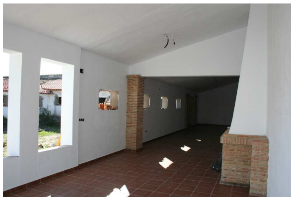
Obras del Centro de Interpretación.

En el proyecto participan las comarcas de Valle del Alagón (Cáceres), Hellín (Albacete), Lácara (Badajoz) y Miajadas-Trujillo (Cáceres). Gracias a esta iniciativa se está construyendo el Centro de Interpretación del Regadío y la Colonización en Alagón, se han constituido plataformas comarcales de colonos, realizado una web, encuentros de colonos en las comarcas y la realización de un documental que recoge la vida de los vecinos desde la creación de los poblados.