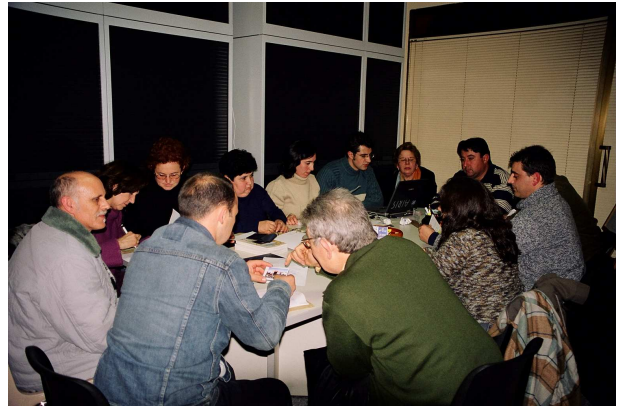
Asamblea constituyente "ARCOAL".

Con la intención de revalorar espacios municipales infrautilizados hemos financiado 7 estudios en varias de las dehesas de la comarca para de esta forma tratar de garantizar su uso y gestión futura. En uno de esos casos el resultado ha sido la puesta en marcha del Centro de Interpretación de la Dehesa en Aceituna. En la línea de la recuperación del patrimonio hemos intervenido en la recuperación de iglesias y ermitas como las de Pozuelo de Zarzón, Montehermoso, Torrejoncillo o Coria, en la catalogación del archivo musical de la Catedral de Coria, en la digitalización del archivo histórico de Coria o en la creación del parque temático de Extremadura en Montehermoso.