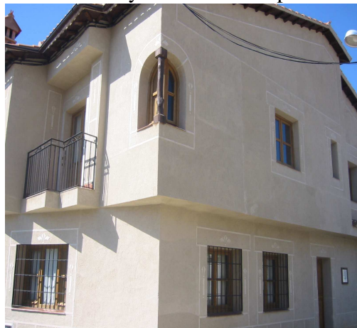
La Fragua. Valdeobispo.