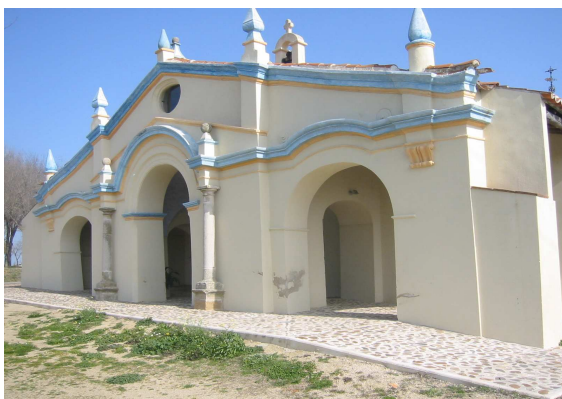
Rehabilitación de la Ermita Virgen de Argeme de Coria.